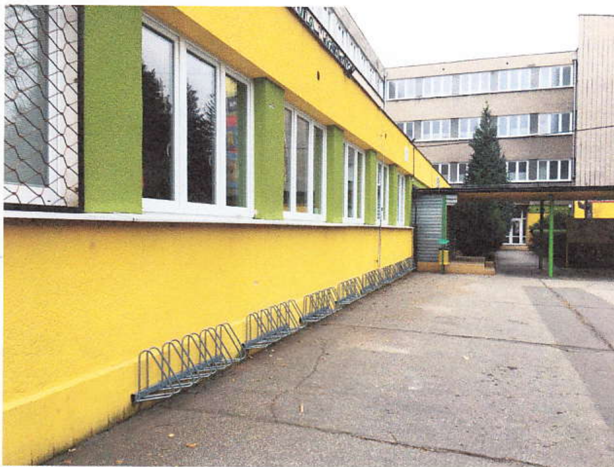
Obrázok 5 Stojany bicyklov