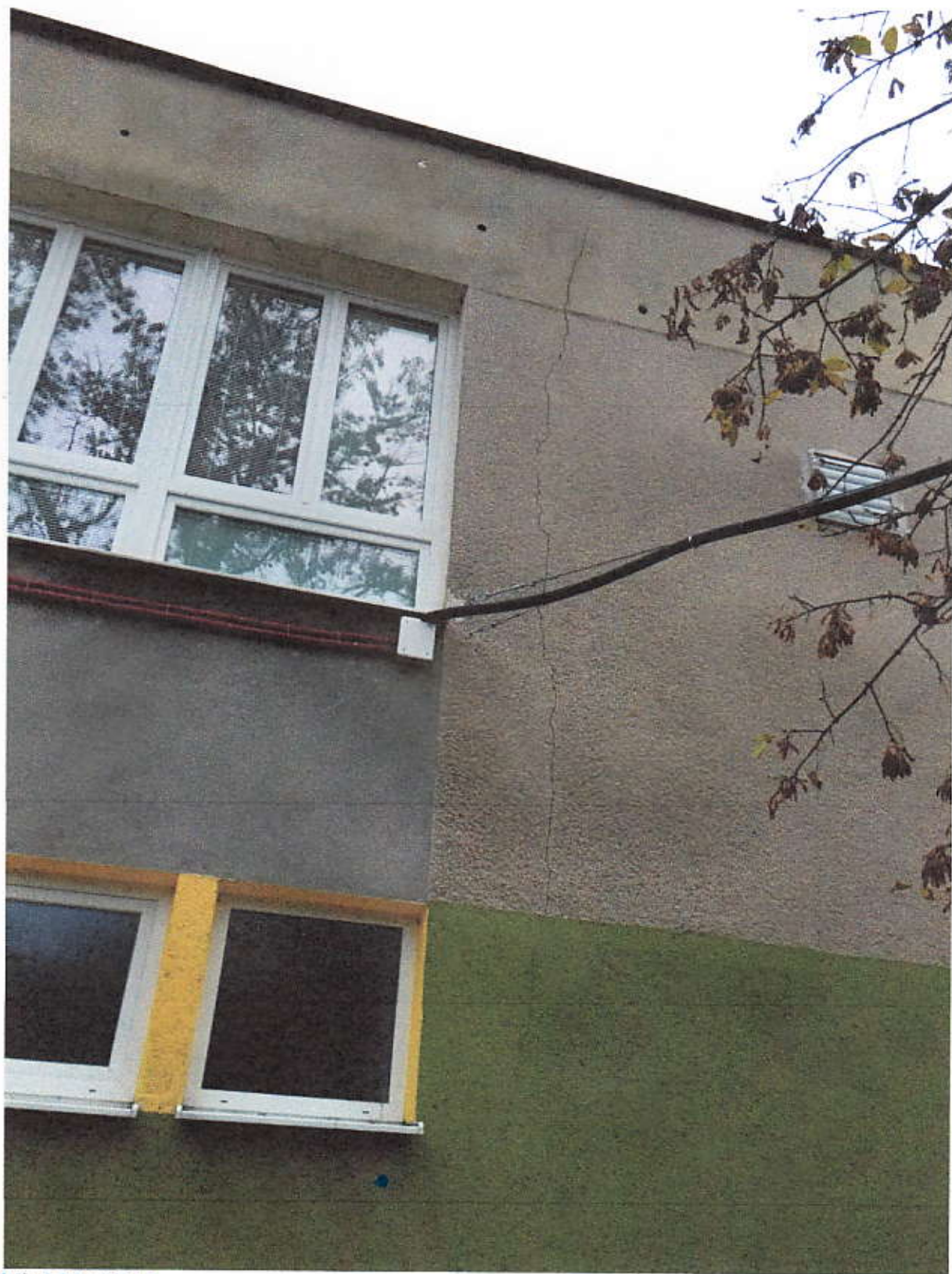
Obrázok 3 Prasklina 1