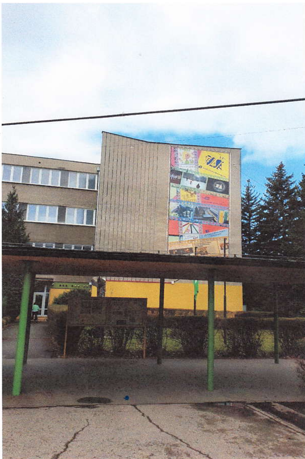
Obrázok 1 Billboard