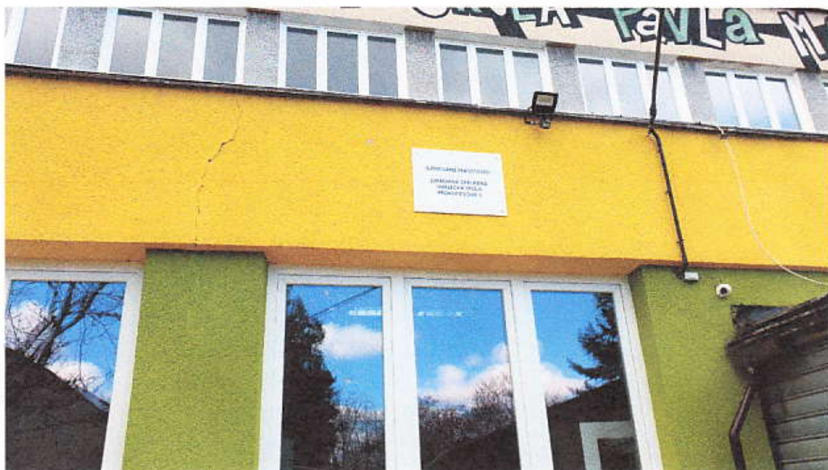
Obrázok 2 popisná tabuľa